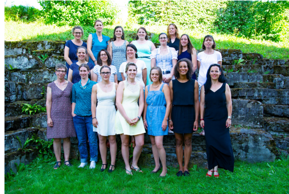
Fachausbildung Bäuerin berufsbegleitend 2016 – 2018 Schultag Freitag – Feb16f

Wir wünschen allen Absolventinnen der Fachausbildung Bäuerin, dass sie das Erlernete tagtäglich und mit viel Freude einsetzen und gerne an die Zeit in der Bäuerinnenschule am Strickhof zurückdenken.