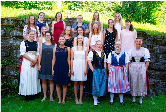
Fachausbildung Bäuerin Vollzeit 2018 – Fav18