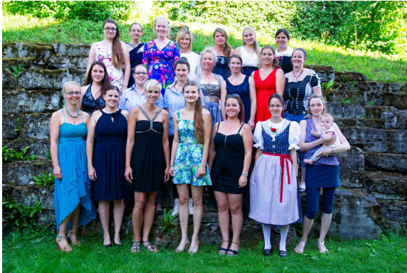
Fachausbildung Bäuerin berufsbegleitend 2016 – 2018 Schultag Mittwoch – Feb16m